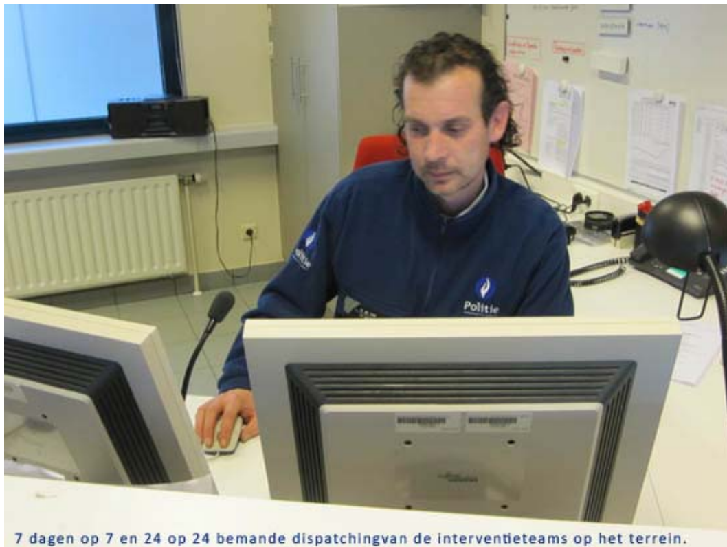
7 dagen op 7 en 24 op 24 bemane dispatching van de interventieteams op het terrein.