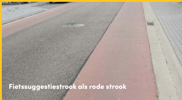
Fietssuggestiestrook als rode strook

Dit onderbord kan ook aangeven dat het fietspad moet gevolgd worden door de bestuurders van tweewielige bromfietsen klasse B.