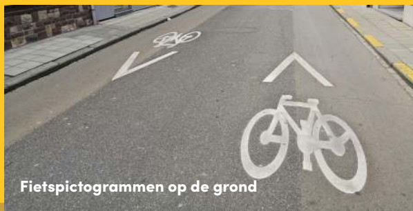
Fietspictogrammen op de grond