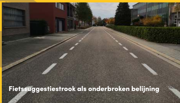
Fietssuggestiestrook als onderbroken belijning