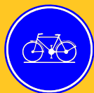
Verkeersbord D7: Verplicht fietspad

De strook maakt vooral duidelijk dat er fietsers kunnen rijden. Voor de automobilist versmallen ze de straat visueel – zodat hij trager gaat rijden – en ze wijzen op de mogelijke aanwezigheid van fietsers. Fietsers hebben geen specifieke rechten op een suggestiestrook