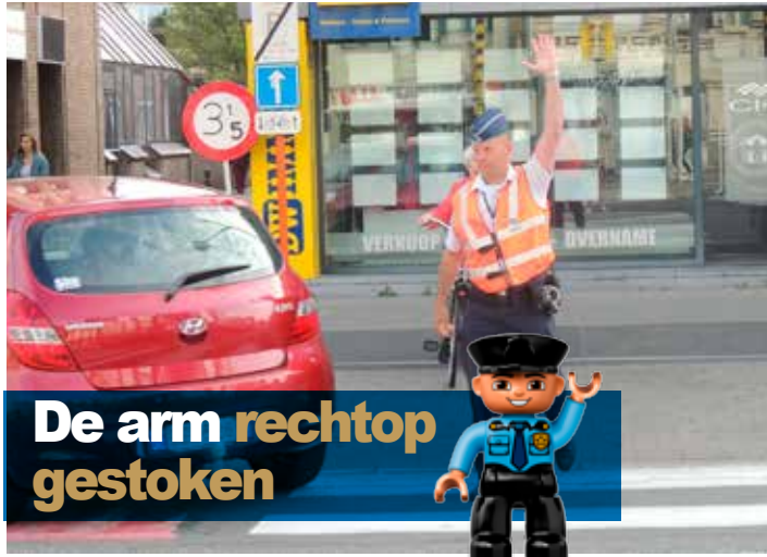
De arm rechtop gestoken

Iedereen weet dat de bevelen van de bevoegde personen om het verkeer te regelen boven de verkeerslichten, de verkeerstekens en de verkeersregels gaan doch een herhaling van de verschillende bestaande bevelen is zonder twijfel niet overbodig... We sommen de belangrijkste bevelen even op: