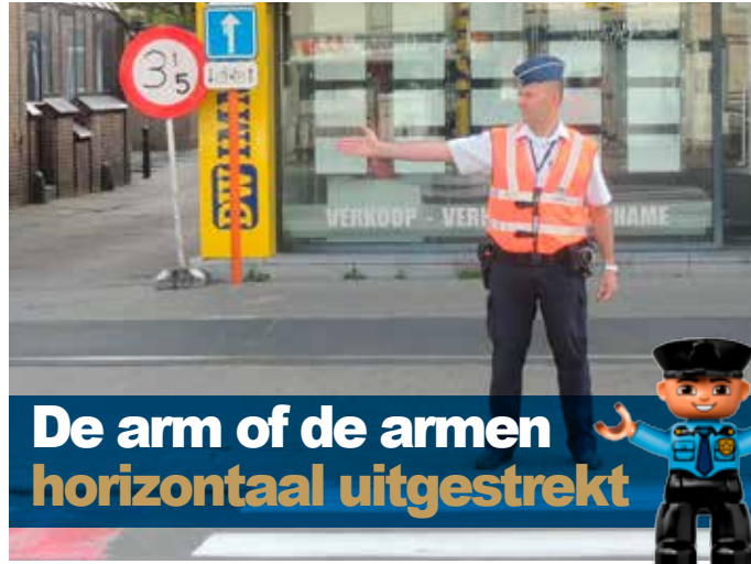
De arm of de armen horizontaal uitgestrekt

Het betekent stoppen voor alle weggebruikers , behalve voor die welke zich op een kruispunt bevinden en dit dan ook moeten vrijmaken. Je kan het vergelijken met een kruispunt met driekleurige verkeerslichten waarbij de fase voor u op dat ogenblik oranje is.