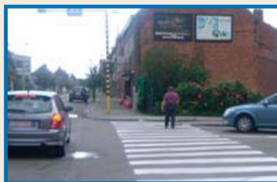
De bestuurder die van rechts komt moet voorrang verlenen aan de voetgangers op de oversteekplaats maar behoudt zijn voorrang tegenover de andere bestuurders op de rijbaan.