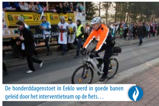
De honderddagenstoet in Eeklo werd in goede banen geleid door het interventieteam op de fiets...

Ook Eeklo Run mocht op politiebegeleiding per fiets rekenen.