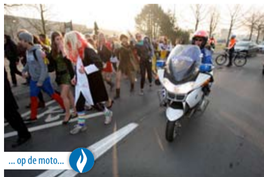
... op de moto...