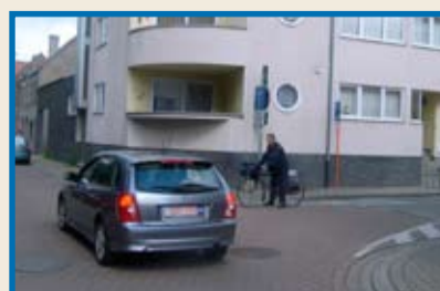
De fietser die van rechts komt uit een straat met beperkt éénrichtingsverkeer en die is gestopt, behoudt zijn voorrang.