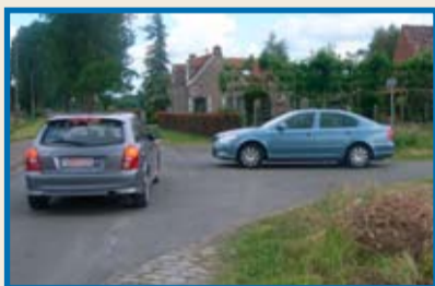
De bestuurder die van rechts komt en is gestopt, behoudt zijn voorrang.