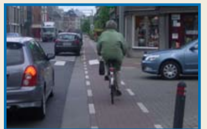
De bestuurder die van rechts komt moet voorrang verlenen aan de weggebruikers op het fietspad, maar behoudt zijn voorrang tegenover de andere bestuurders op de rijbaan.