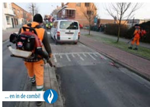
... en in de combi!