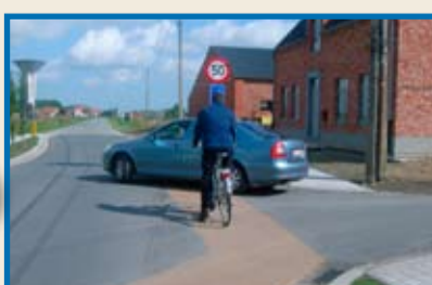
De bestuurder die van rechts komt en de fietssuggestiestrook over rijdt, behoudt zijn voorrang.