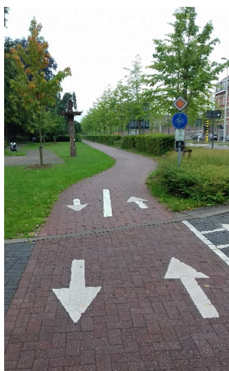
Fietspad dubbele richting

Rijd je toch in de verboden richting, dan breng je zowel jezelf als de andere weggebruikers in gevaar. Bovendien riskeer je een verkeersboete van 58 euro.