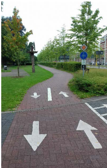
Fietspad dubbele richting

Rijd je toch in de verboden richting, dan breng je zowel jezelf als de andere weggebruikers in gevaar. Bovendien riskeer je een verkeersboete van 58 euro.