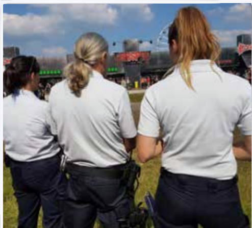
Toezicht op Graspop Metal Meeting