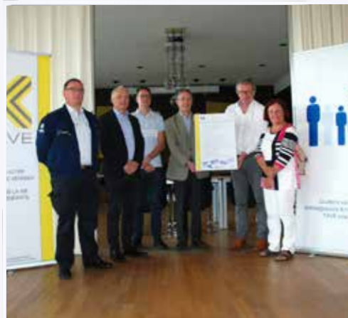
Ondertekening SAVE charter Steden en Gemeenten van Ouders van Verongelukkten Kinderen door de gemeente Balen