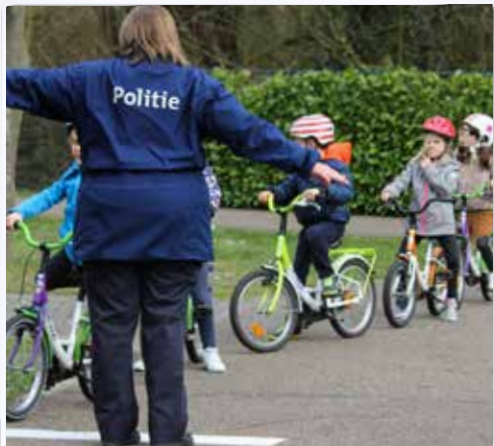
Het Verkeerseducatief Centrum in Mol bestaat dit jaar 50 jaar. Heel wat schoolkinderen krijgen er verkeerseducatie en praktijkoefeningen op maat.