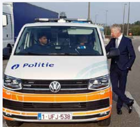
Minister de Crem bezoekt snelwegparking langs grensovergang in Mol-Postel voor besprekingen rond aanpak transmigrantenproblematiek