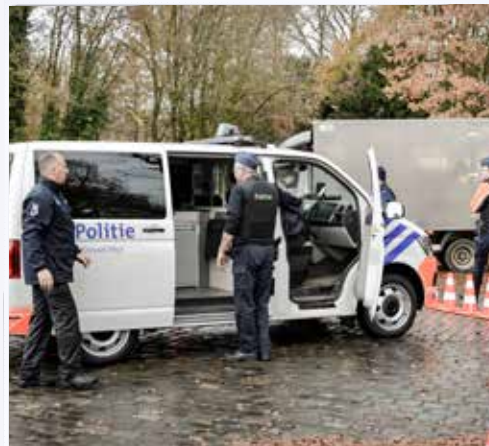
Grenscontrole in Postel