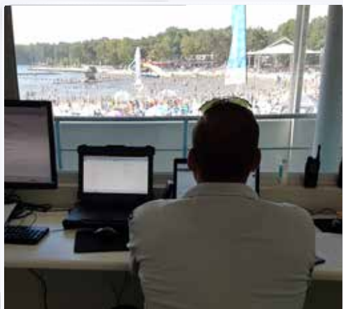
Toezicht op uiterst warme editie van Pennenzakkenrock