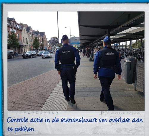
09847007348 POLAROID32 Controle actie in de stationsbuurt om overlast aan te pakken