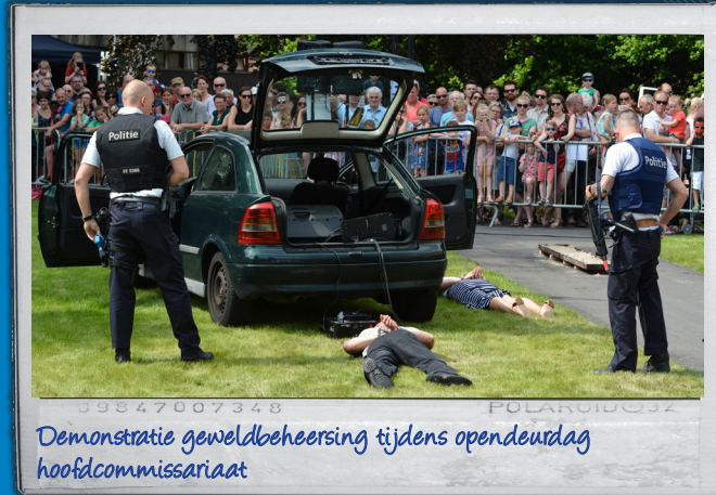
09847007348 POLAROID32 Demonstratie geweldbeheersing tijdens opendeurdag hoofdcommissariaat