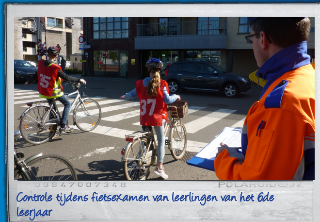
09847007348 POLAROID32 Controle tijdens fietsexamen van leerlingen van het 6de leerjaar