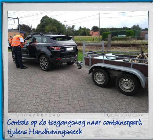
09847007348 POLAROID32 Controle op de toegangsweg naar containerpark tijdens Handhavingsweek