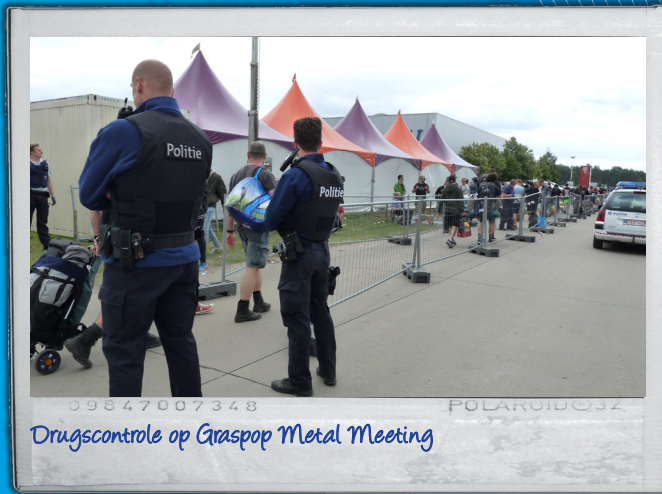
09847007348 POLAROID32 Drugscontrole op Graspop Metal Meeting