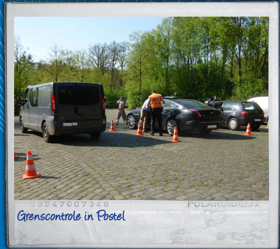
09847007348 POLAROID32 Grenscontrole in Postel