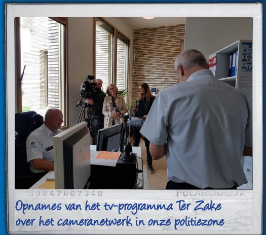
09847007348 POLAROID32 Opmnames van het tv-programma Ter Zake over het cameranetwerk in onze politiezone