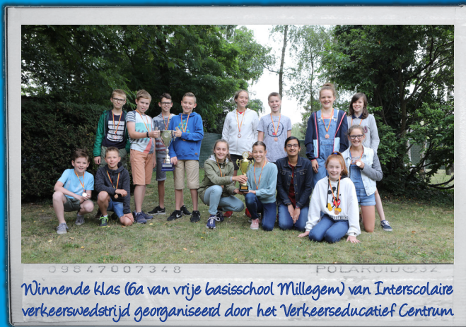
09847007348 POLAROID32 Winnende klas (6a van vrije basisschool Millegem) van Intercolaire verkeerswedstrijd georganiseerd door het Verkeerseducatief Centrum